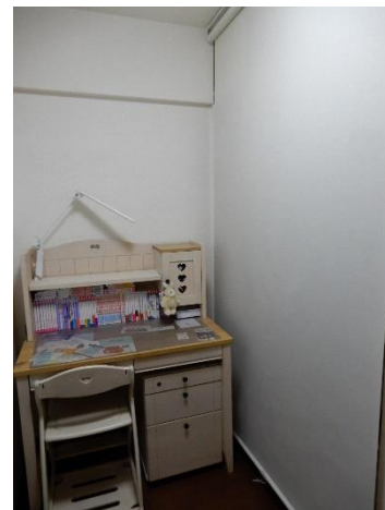
2階のベッドの向かい側は扉を撤去して ロールスクリーンにしたクローゼット