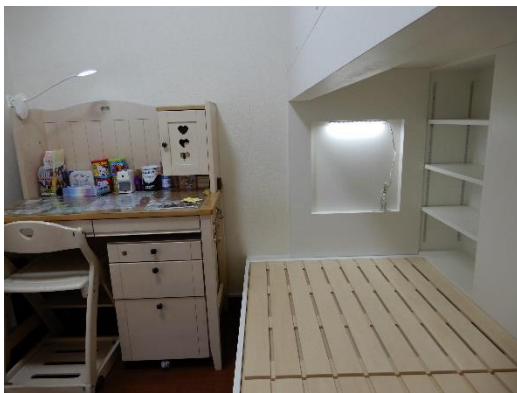
1階側既存デスクを使用