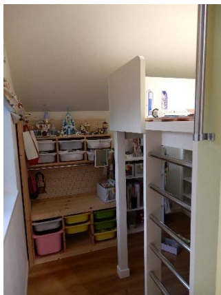
2階ベッドの妻側登り口