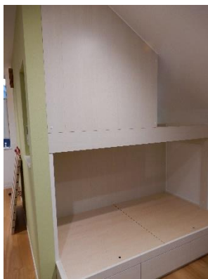
1階ベッド左側上部が2階ベッドの妻側