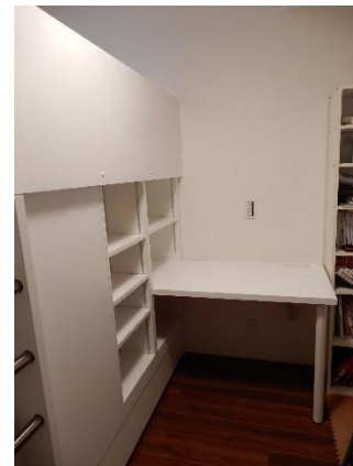
2階ベッド側、デスク新設