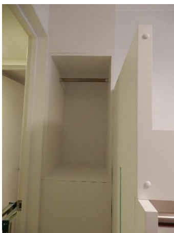
ベッドと壁の隙間クローゼットは上段が2階ベッド側、下段が1階ベッド側